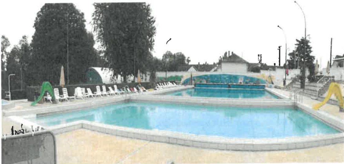
Piscine municipale de MER